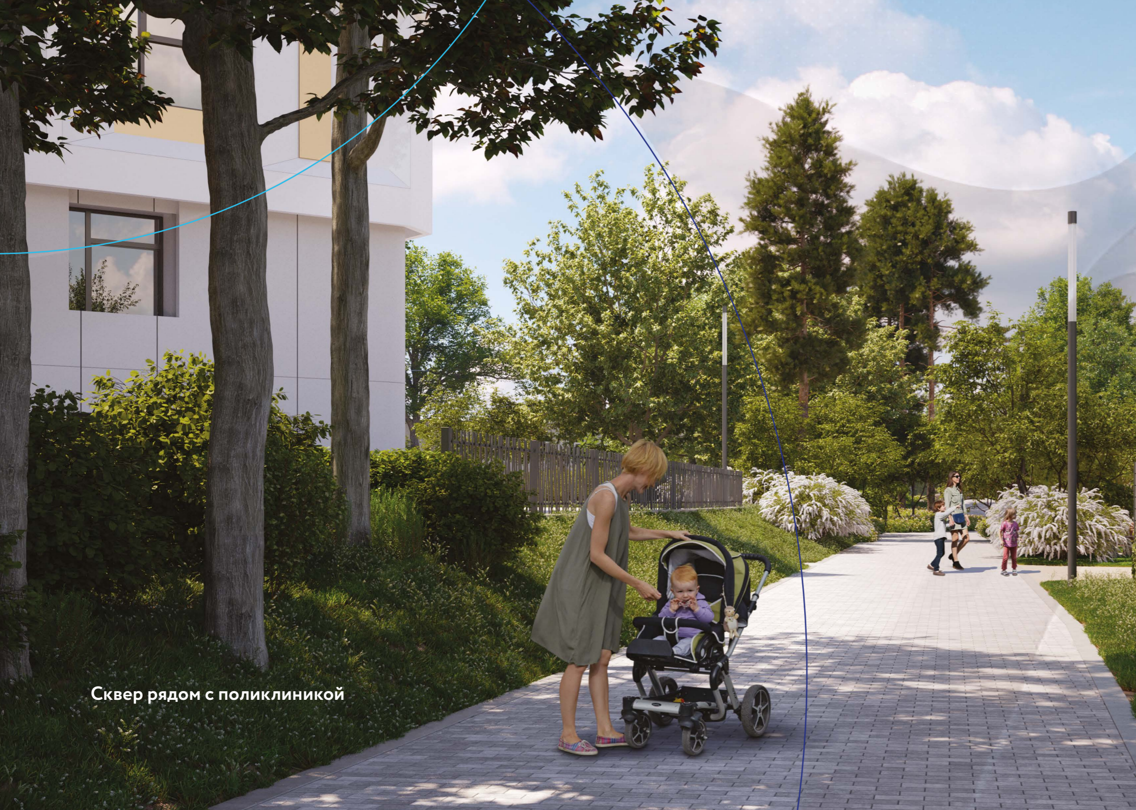
Сквер рядом с поликлиникой