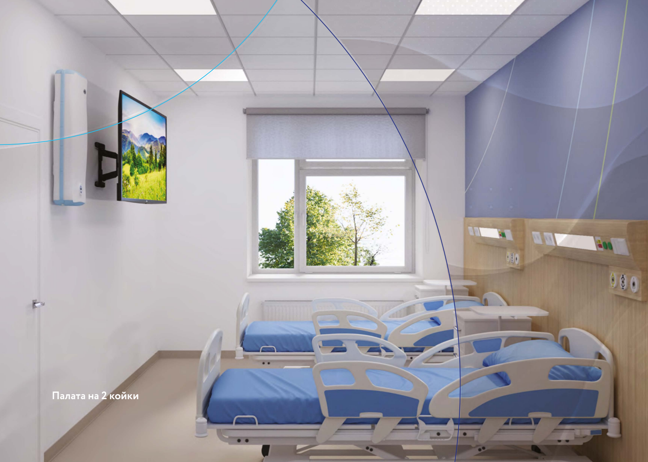
Палата на 2 койки