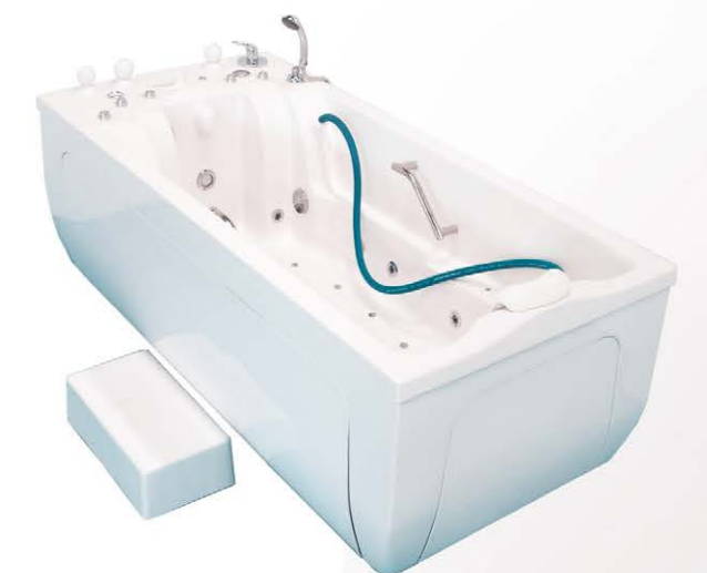
Ванна водолечебная «Ладога»