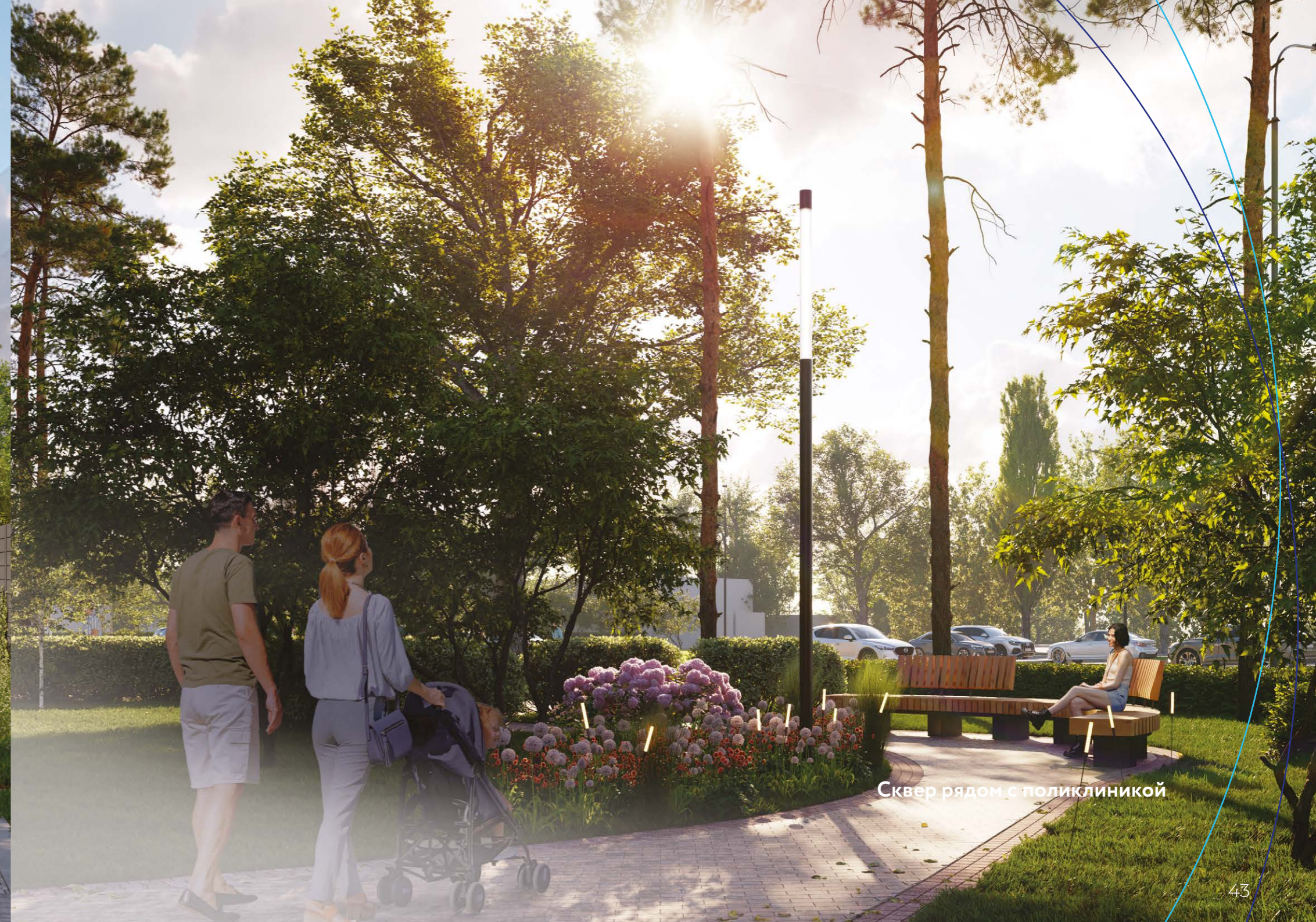
Сквер рядом с поликлиникой