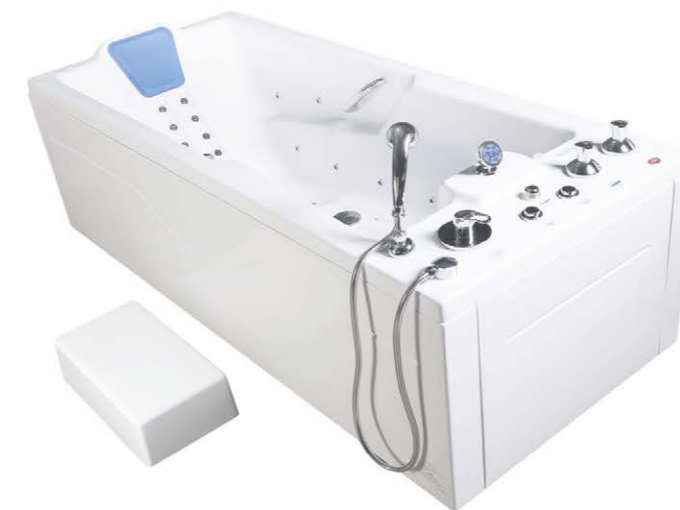
Ванна водолечебная «Оккервиль»