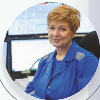
ЗДОРОВЫЙ РАБОТНИК НЛМК